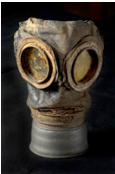
Maschera antigas tedesca. Ritrovata sul Piave nella zona di Lovadina (Museo di Maserada).

Colin Dutton , ripercorre i luoghi del conflitto per fissare immagini e sensazioni che rischiano di essere dissolte dall'oblio del tempo. Uno sguardo fotografico accompagnato dal cupo dolore della morte che ha impregnato i luoghi, nel tentativo di riattivare il difficile e complesso atto del ricordare, " che richiede adesione e desiderio di oltrepassare la cortina del buio ".