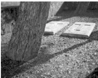
Cippo degli Arditi. Volpago del Montello. Fotografia di Loris Menegazzi.

Loris Menegazzi , nei suoi scatti in bianco e nero, si sofferma davanti ai monumenti della Grande Guerra. Tali omaggi ai caduti divengono i simboli dello slancio collettivo di una comunità e dei suoi ideali e al contempo sono pregni della sofferenza delle storie personali di sacrificio. “Sostare davanti ad un monumento è il primo passo per riappropriarsi di una consapevolezza” e per riacquistare il senso di appartenenza.